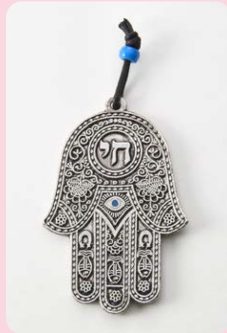
Foto: chamsa met daarop חי ('chai'), dat 'leven' betekent, ca. 1990 - 2000

In veel culturen is de hand een symbool van bescherming tegen ongeluk. In de Joodse traditie wordt de chamsa gezien als de beschermende hand van God. Soms wordt het 'de hand van Mirjam' genoemd, naar de zuster van Mozes en Aäron. In de islam wordt de chamsa ook 'de hand van Fatima' genoemd, naar de dochter van de profeet Mohammed. In het hindoeïsme wordt het een chumsah genoemd. ●