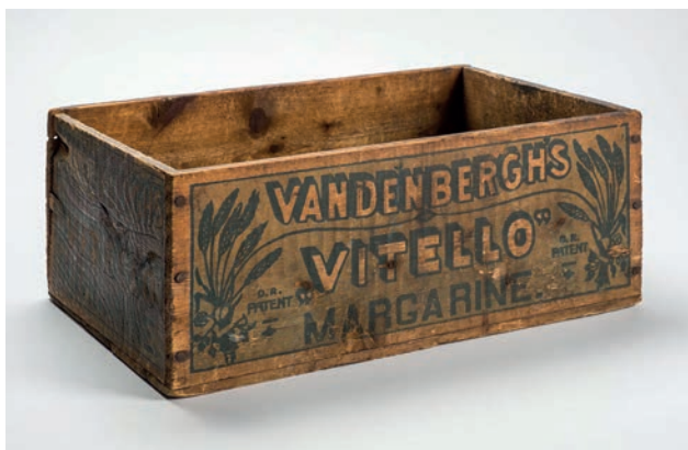
Collectie Joods Historisch Museum. Aangekocht met steun van de BankGiro Loterij

Ruim 2300 objecten vertellen het verhaal van de Nederlands-joodse geschiedenis. Zaken die het dagelijks leven weergeven, waaronder onder meer herinneringsobjecten, gereedschap, reclamemateriaal, speelgoed. Een belangrijk deelgebied betreft objecten uit het joodse bedrijfsleven. Dit verzamelgebied heeft extra nadruk gekregen door het onderzoek voor de tentoonstelling Venter Fabriqueur Fabrikant. Joodse ondernemers en ondernemingen in Nederland 1796-1940 . Kennis is ook opgedaan bij de tentoonstellingen over de joden in Nederlands Indië en Suriname waardoor de wens nog duidelijker is geworden meer objecten uit deze gebieden te verwerven. Op dit moment, in de aanloopfase van de inrichting van het NHM, wordt met meer aandacht gekeken naar de collectie objecten uit de Tweede Wereldoorlog.