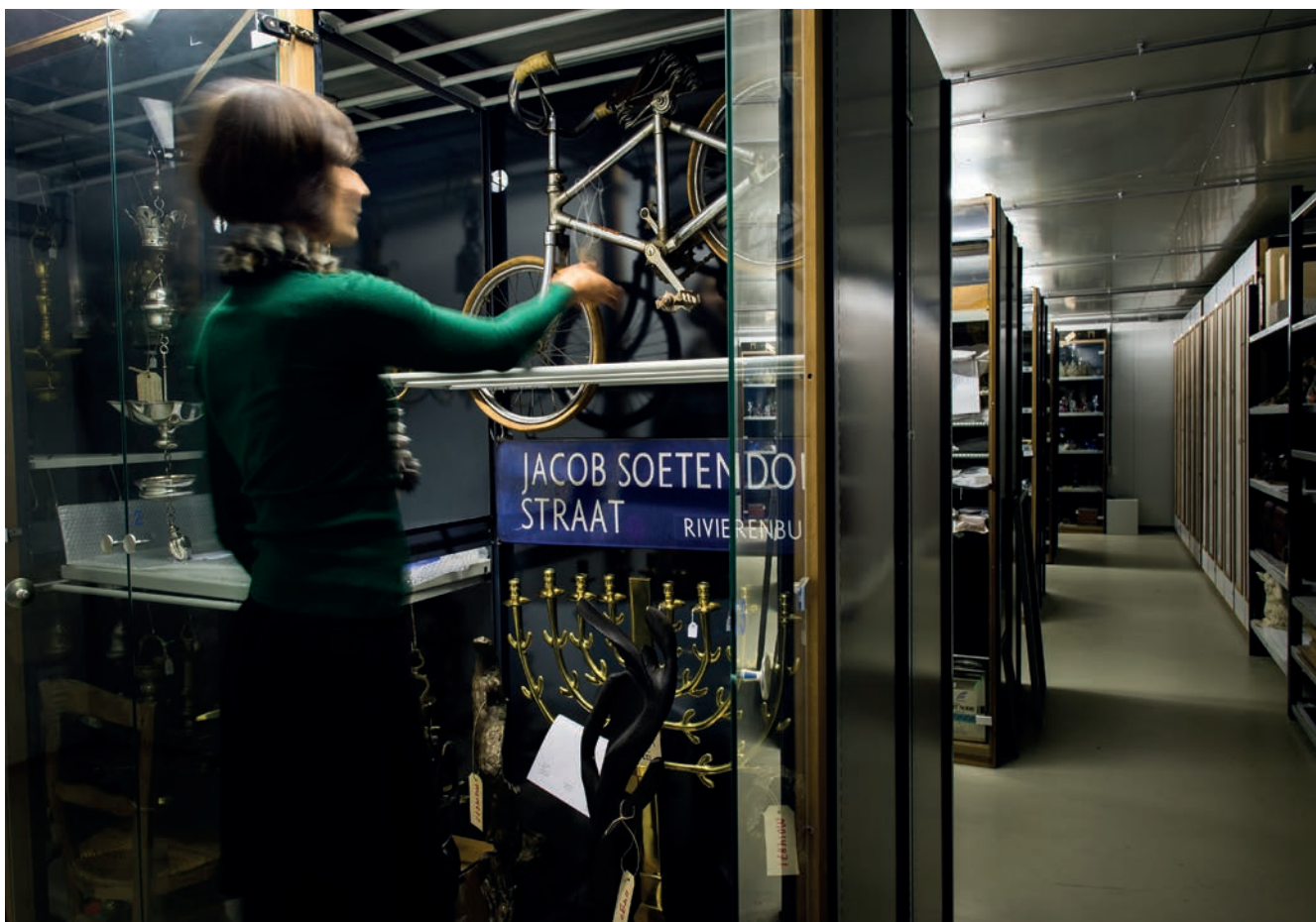
Depot Joods Historisch Museum, Amsterdam.

worden daarin getoetst zodat een duidelijk collectiebeleid gevoerd kan worden.