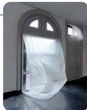
Melancholia in Arcadia, Gabriel Lester.

In de coronaperiode waren veel sterfgevallen te betreuren. Het Joods Museum vroeg daarom Gabriel Lester (Amsterdam, 1972) zijn kunstwerk Melancholia in Arcadia voor de ramen van het Kunstkabinet te installeren. Het werk, een 'wapperend' kanten gordijn dat bevroren is in tijd en ruimte, is geïnspireerd op een Joods rouwritueel, waarbij de ramen worden geopend om de ziel van de overledene de ruimte te geven het lichaam te verlaten.