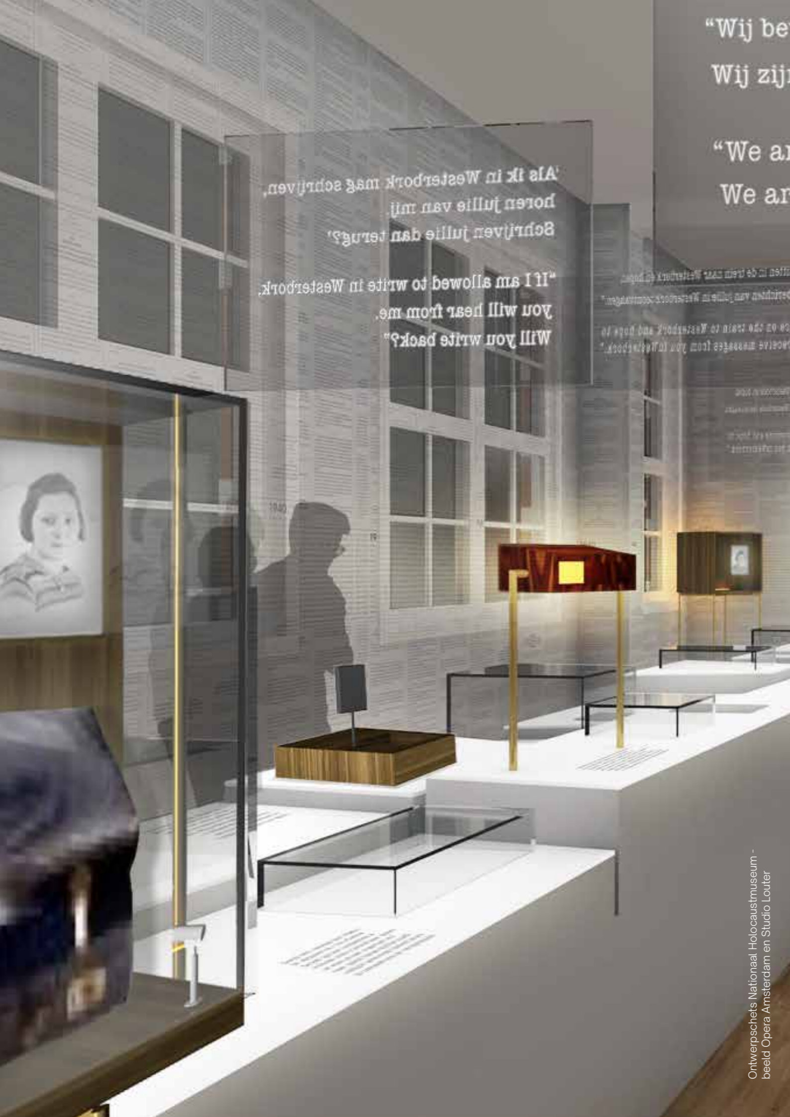
Ontwerpschets Nationaal Holocaustmuseum - beeld Opera Amsterdam en Studio Louter