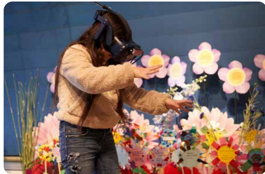
Virtual reality.