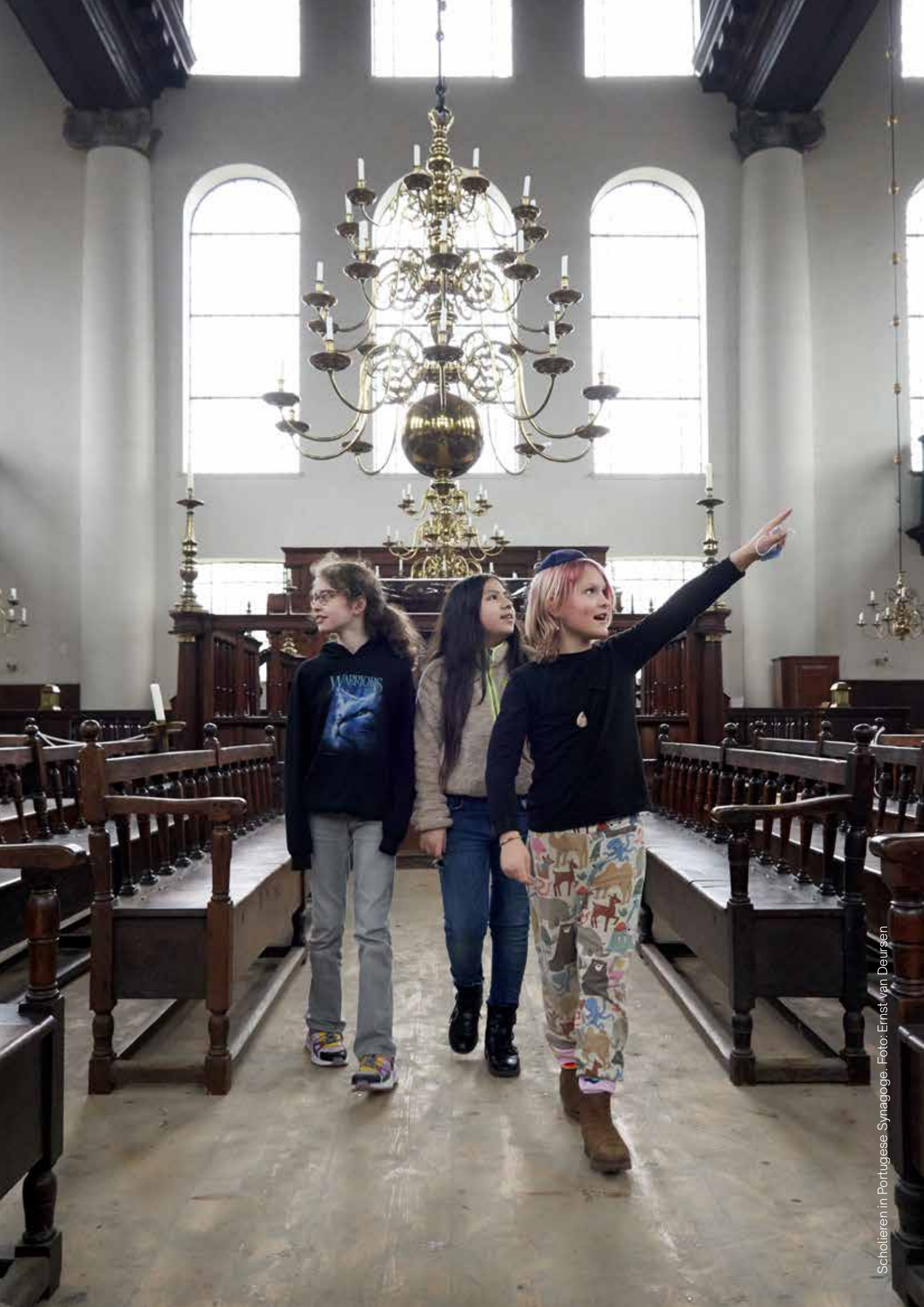
Scholieren in Portugese Synagoge.