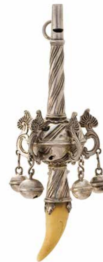
Collectie Keijser, inv. nr. 0114.

‘Wat een geweldige prachtige verzameling!’