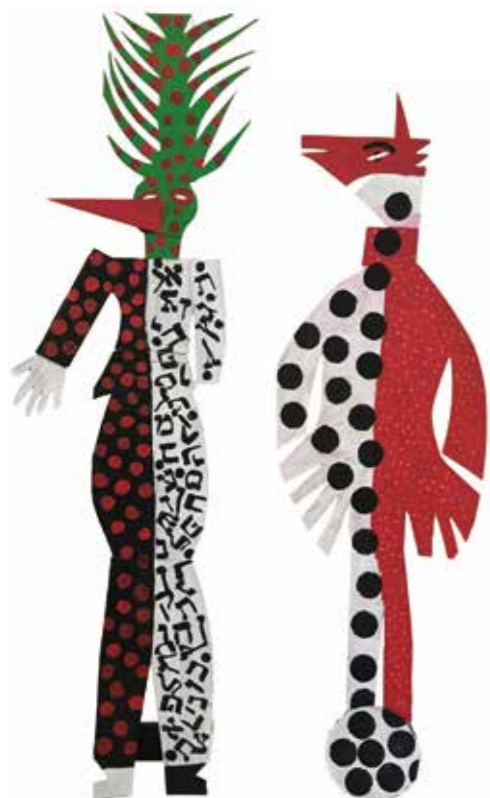
Figuren uit Droombos, Joods Museum Junior (Joods Cultureel Kwartier), 2019. © Eli Content

Eden en de Gulden Regel is een ervaring voor jong en oud, die VR-kunstenaar en verhalenverteller Abner Preis heeft gemaakt voor de zolder van het Joods Museum junior. Met een VR-bril op gaat de bezoeker met het meisje Eden mee op een magische reis om de betekenis van de Gulden Regel te ontdekken. Deze leefregel blijkt al duizenden jaren te bestaan en in culturen over de hele wereld voor te komen: 'Wat jij niet wilt dat jou geschiedt, doe dat ook een ander niet.' Terug van de VR-reis kunnen kinderen een eigen bloem knutselen om daarmee de wereld mooier te maken.