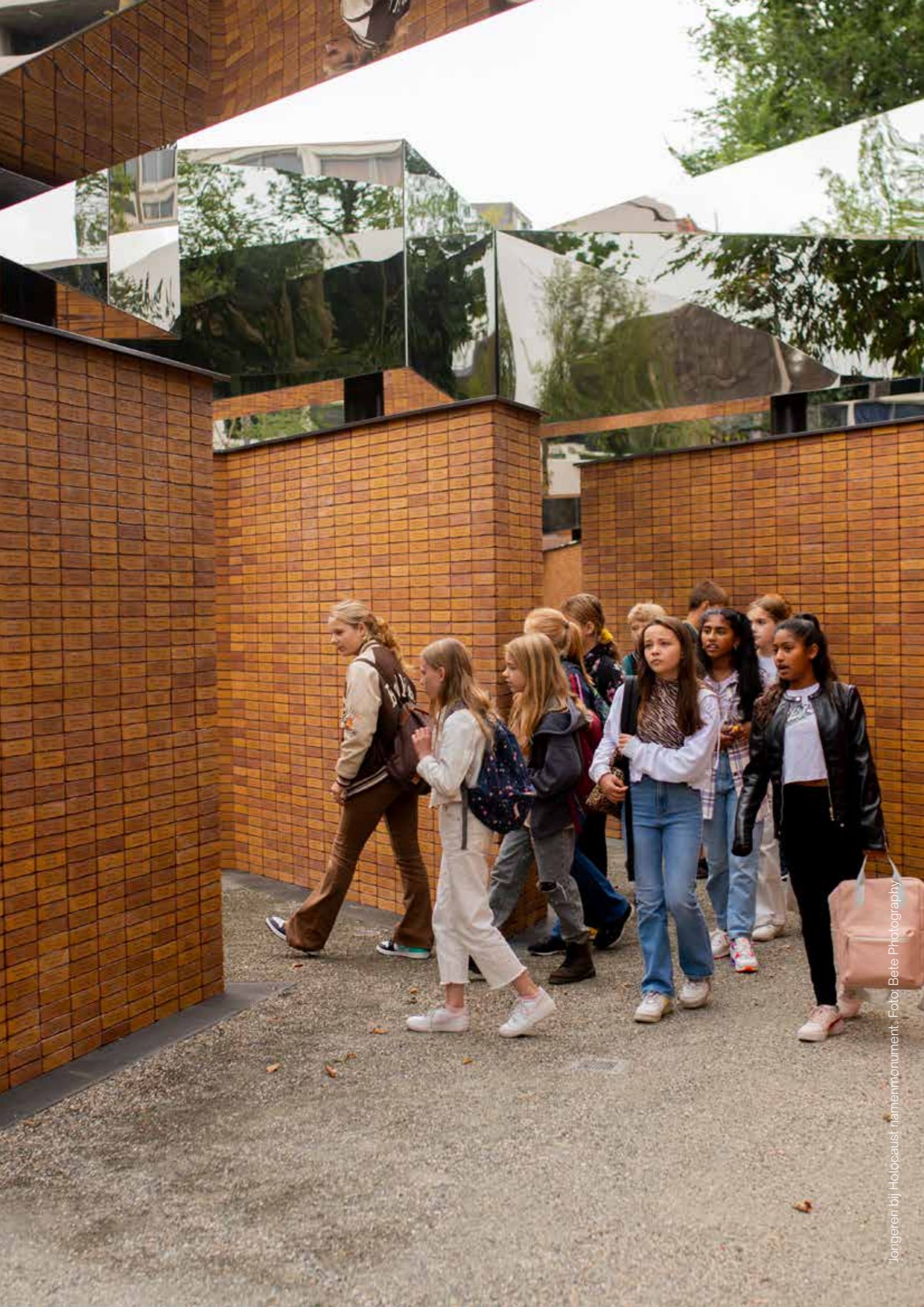
Jongeren bij Holocaust-namenmonument.