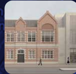
Artist impression Nationaal Holocaustmuseum: beeld Office Winhov